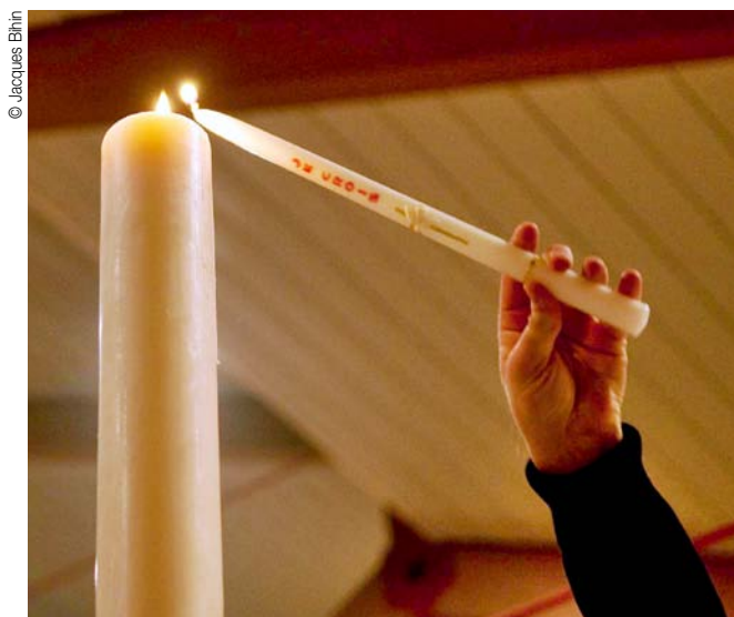
'Dieu fait briller une lumière que les ténèbres ne peuvent saisir'

Jésus a remporté l'âpre, le terrible combat contre les ténèbres. Confronté à la jalousie et la méchanceté, la cupidité et la violence, l'aveuglement et la bêtise, Jésus