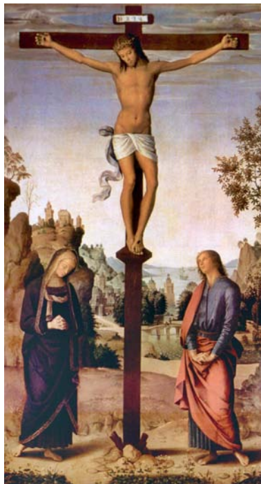
Pietro Perugino, 1482. National Gallery, Washington

(on fit les mêmes reproches à Bach pour sa Passion selon saint Matthieu), mais c'est cela qui assurera le succès de son Stabat Mater pour la postérité, une œuvre écrite in extremis quasi sur son lit de mort (Pergolèse est mort à 26 ans). Pour ces deux partitions, on recommande les enregistrements anciens, mais de référence et toujours disponibles, de Christopher Hogwood (chez Decca).